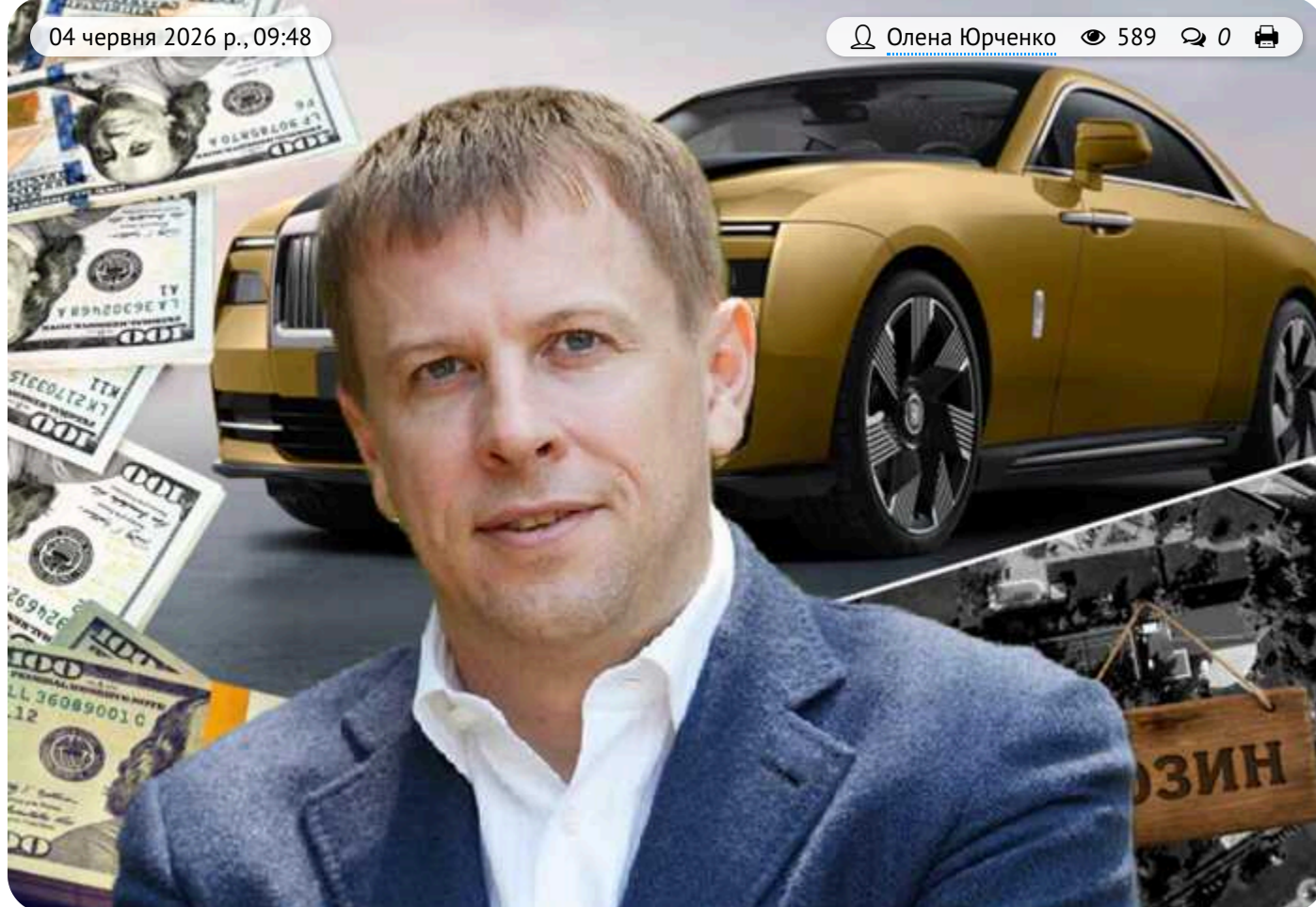
Відмивання коштів та «найдорожчі авто»: правоохоронці розслідують схеми екснардепа Хомутинніка

Головне слідче управління Нацполіції розслідує можливе відмивання коштів компаніями екснардепа Віталія Хомутинніка. Про підозрілий бізнес колишнього "регіонала" та ексгалови депутатської групи "Відродження" вже неодноразово писали ЗМІ.