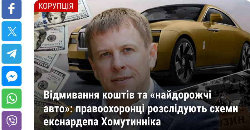
Відмивання коштів та «найдорожчі авто»: правоохоронці розслідують схеми екснардепа Хомутинніка

Ця компанія через закритий корпоративний інвестфонд "Каскад-Інвест" належить Віталію Хомутинніку. До речі, зараз екснардеп зареєстрований у Великій Британії (Лондон, Просвенор Гарденз М'юз Норг, 8).