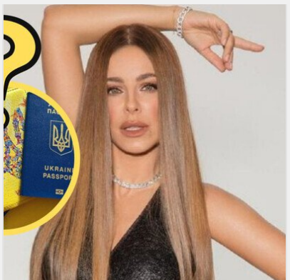
"Прорахувалася, але де?": Росія вказала Ані Лорак на двері ..