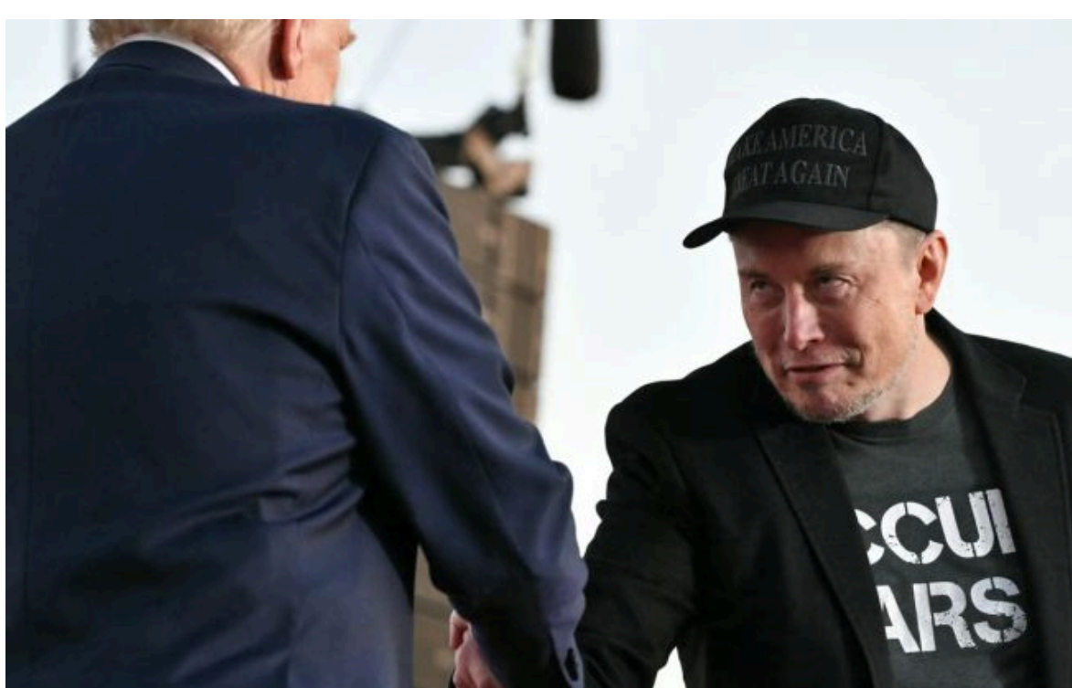
Фото: президент США Дональд Трамп та Ілон Маск