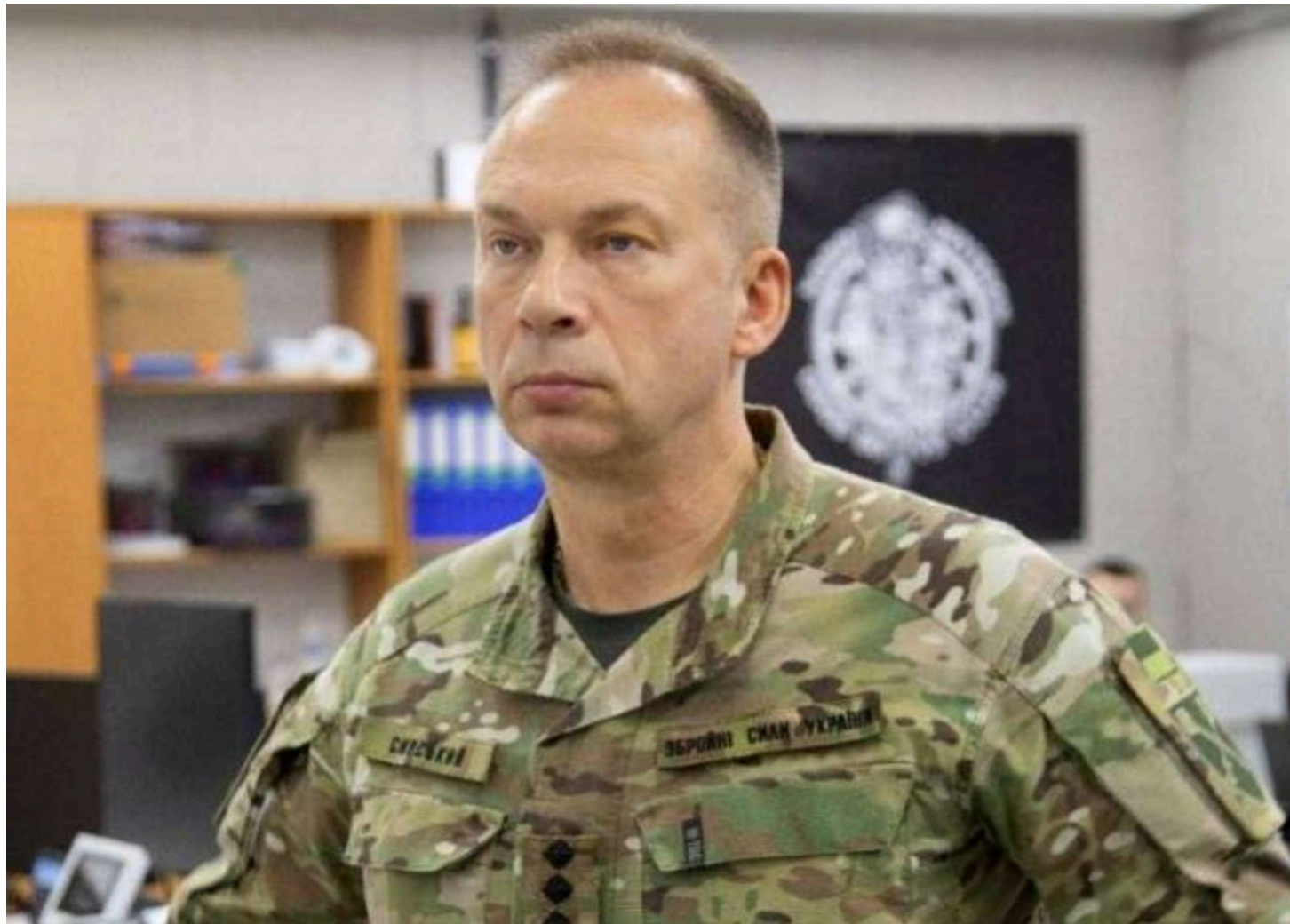
Олександр Сирський

Головнокомандувач ЗСУ Олександр Сирський заявив про дефіцит сучасних систем протиповітряної оборони та ракет до них, наголосивши на необхідності ефективного використання наявних ресурсів і посилення міжнародної допомоги. Про це він написав у соцмережах.