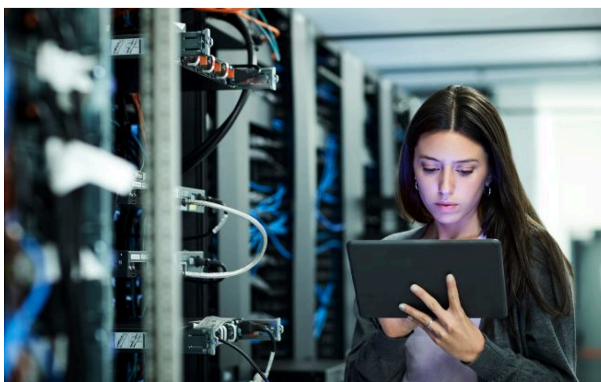
Фото: IT-фахівчиня в серверній залі