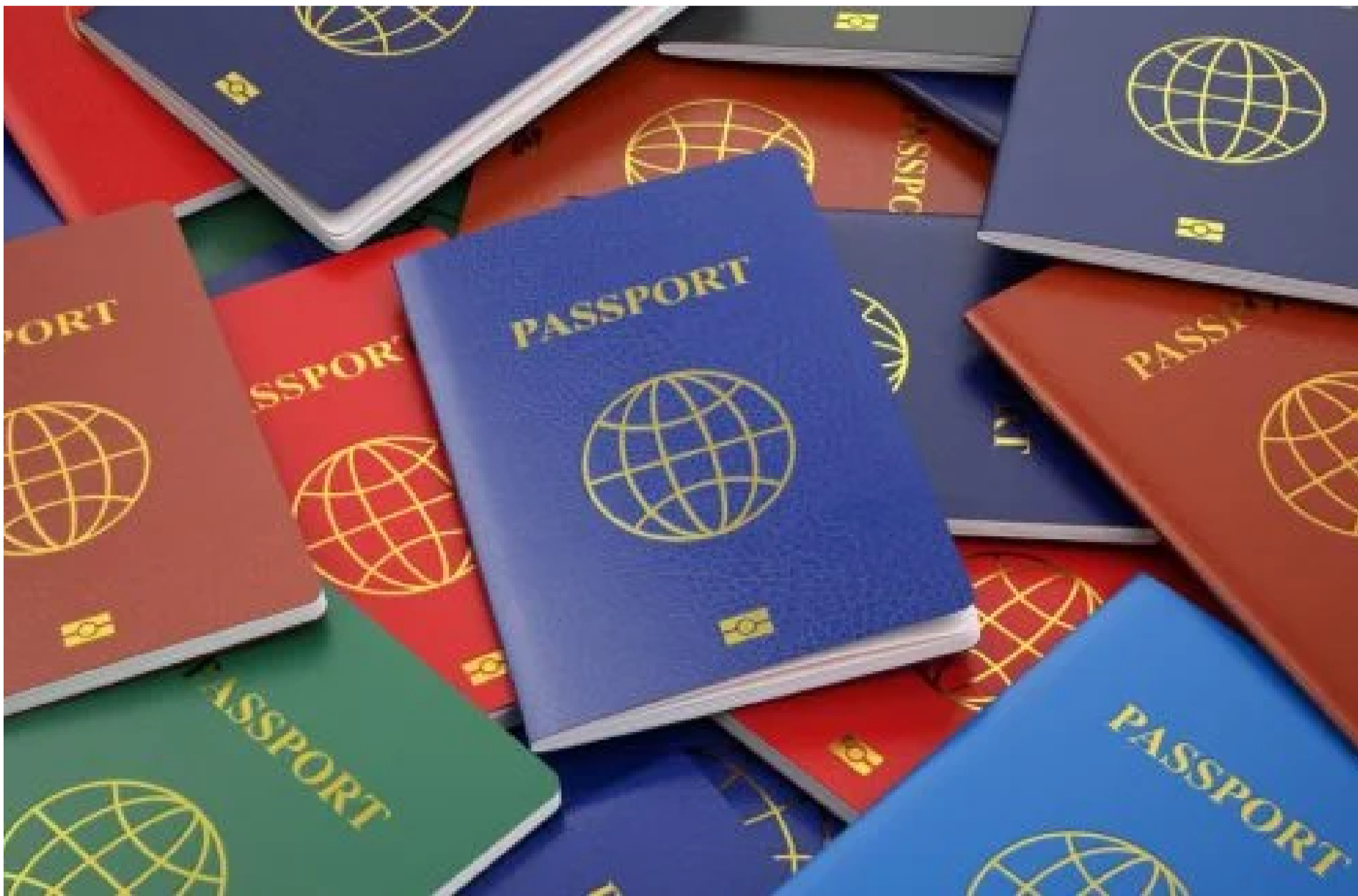
Закордонний паспорт

ТКАЧЕНКО ВАЛЕНТИНА — 04 Червня 2026, 00:33 2 Mins Read — ЦІКАВІ НОВИНИ