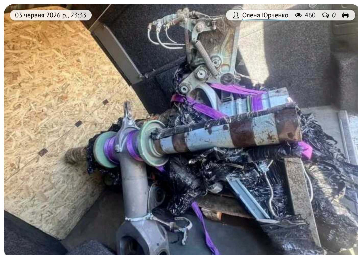
Митники на Закарпатті затримали українця, який намагався вивезти авіаційне шасі без документів

На Закарпатті митники виявили у мікроавтобусі українця металеву конструкцію без маркування, яка за зовнішніми ознаками схожа на шасі літака. Предмет намагалися вивезти до Угорщини без необхідних документів, тому інформацію про можливе порушення передали правоохоронцям.