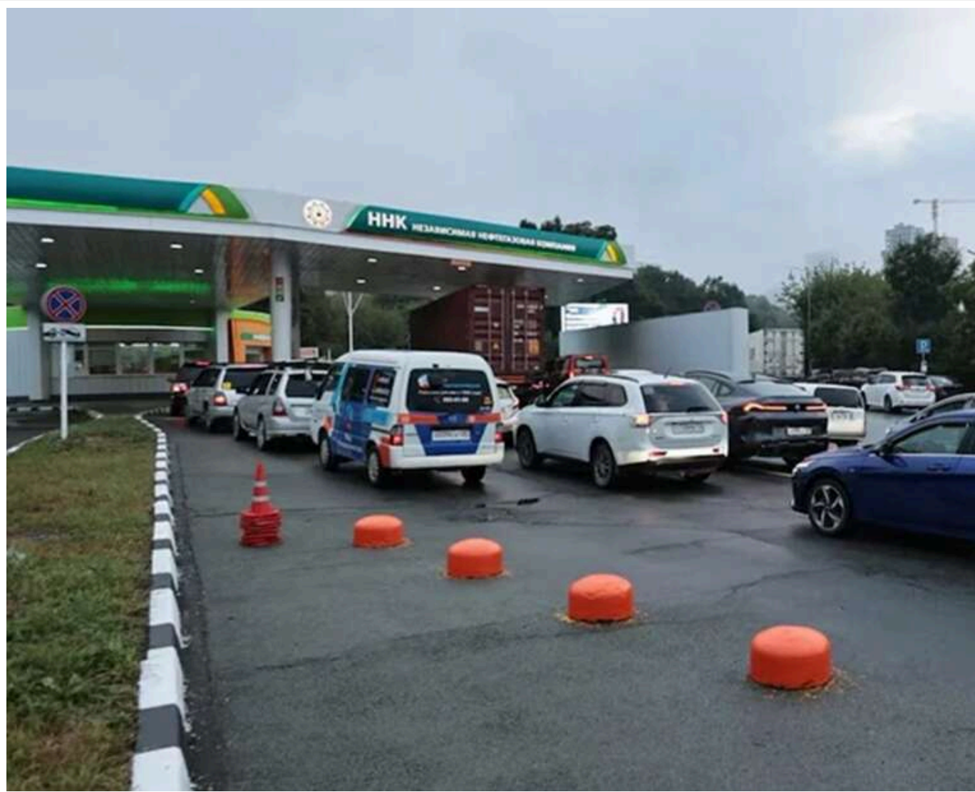
Паливна криза в окупації: на заправках "ДНР" ввели обмеження на бензин

В окупованій частині Донецької області посилюється паливна криза. На низці автозаправних станцій бензин або повністю відсутній, або відпускається лише за талонами. Про це повідомив Маріупольський міський совет з посиланням на «Новини Донбасу».