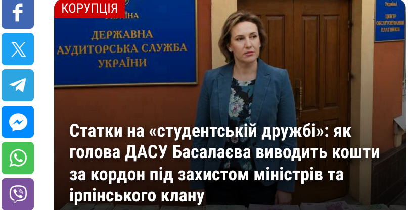
Статин на «студенській друкібі»: як голова ДАСУ Басаласа виводить кошти за кордон під захистом міністрів та ірпінського клану

Unterstützung durch externe Dienstleister