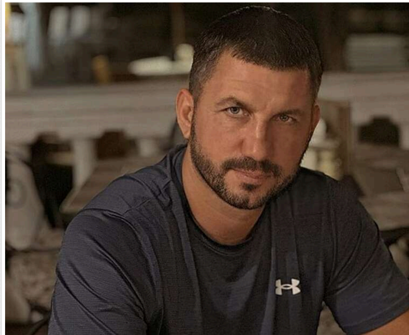
Попри рішення Верховного Суду: зять Гриневецького продовжує заробляти на самобудовах у нацпарку