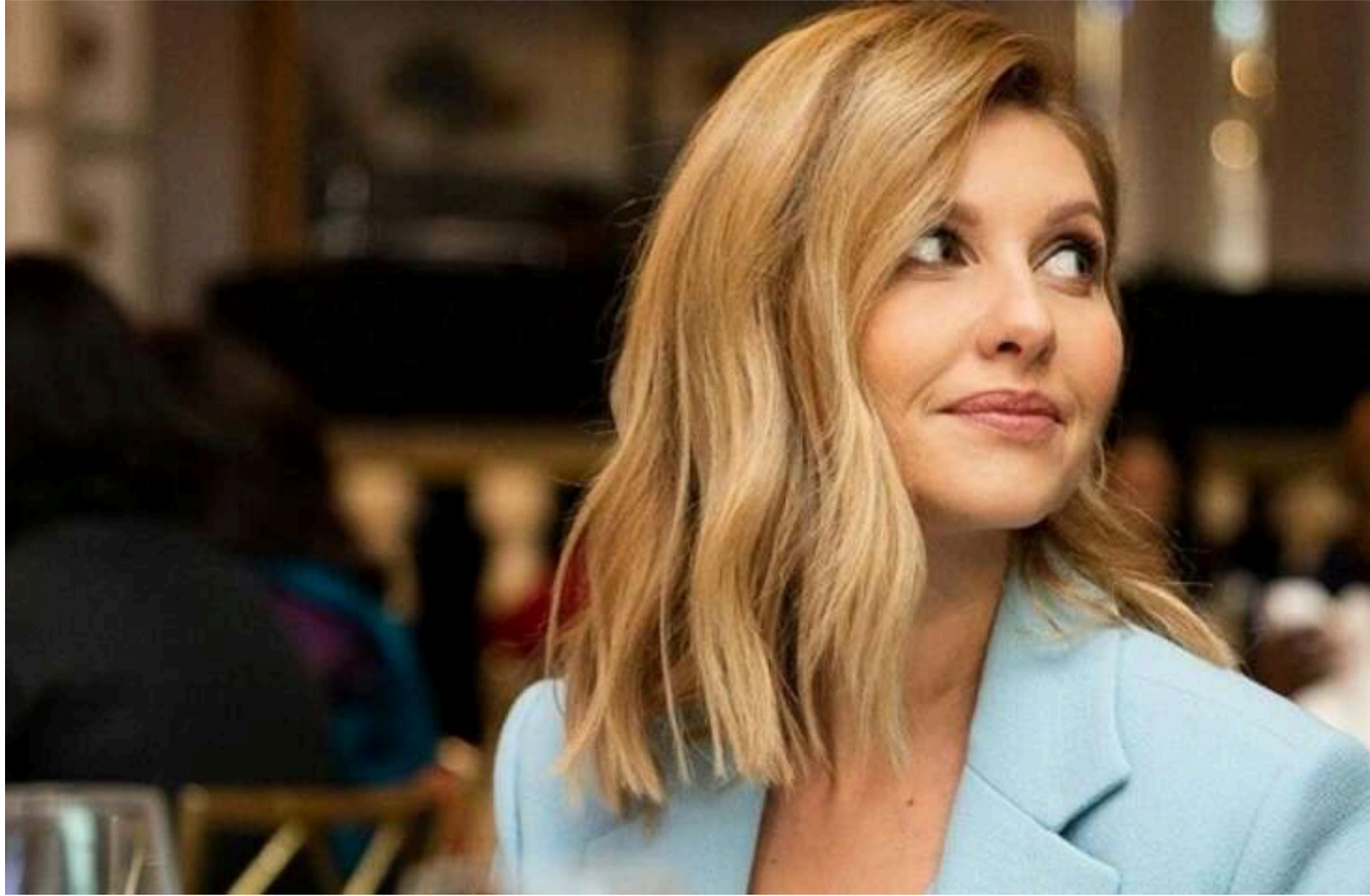
Олена Зеленська

СТЕПАНЕНКО ГРИГОРІЙ — 03 Червня 2026, 20:40 2 Mins Read — МОДА І СТИЛЬ