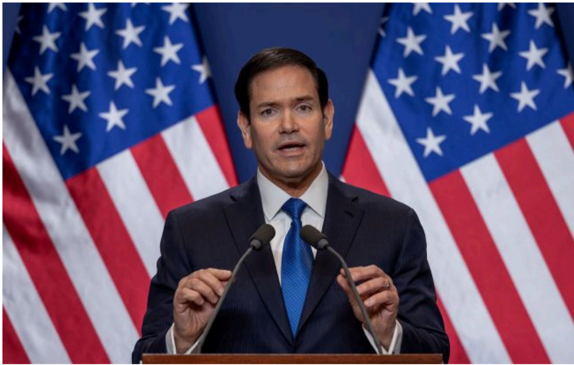
Фото: Марко Рубіо (Gettyimages)