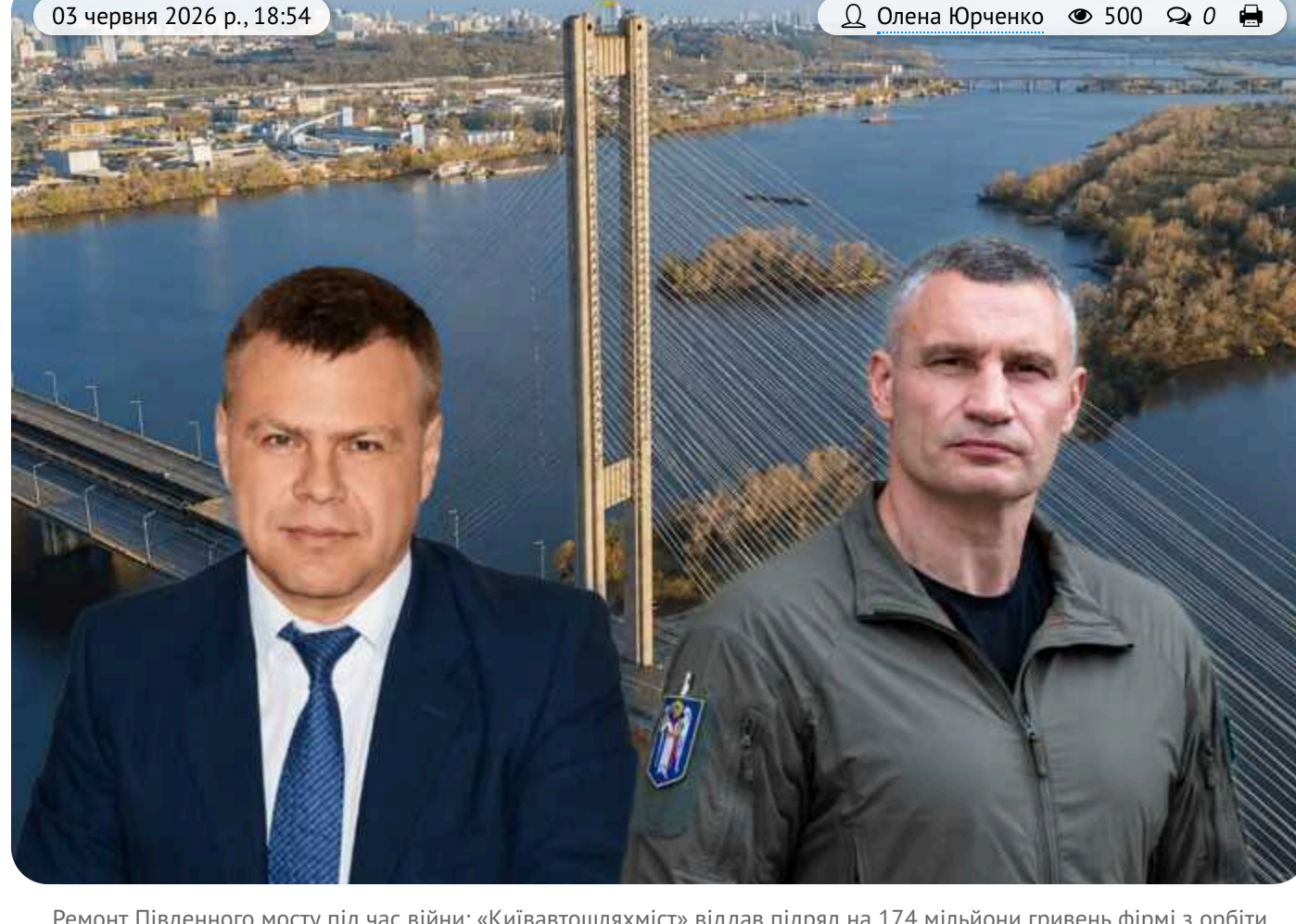
Ремонт Південного мосту під час війни: «Київавтошляхміст» віддав підряд на 174 мільйони гривень фірмі з орбіти Микитася

Столиціне КП «Київавтошляхміст» замовило черговий ремонт Південного мосту та двох його правобережних естакад, оцінивши роботи у понад 174 млн гривень. Підряд отримало ТОВ «Трансдортек» – компанія, яка за останні роки пройшла шлях від торгівлі автозапчастинами до виконання масштабних інфраструктурних проєктів у столиці, а нинішній контракт став для неї найбільшим за всю історію.