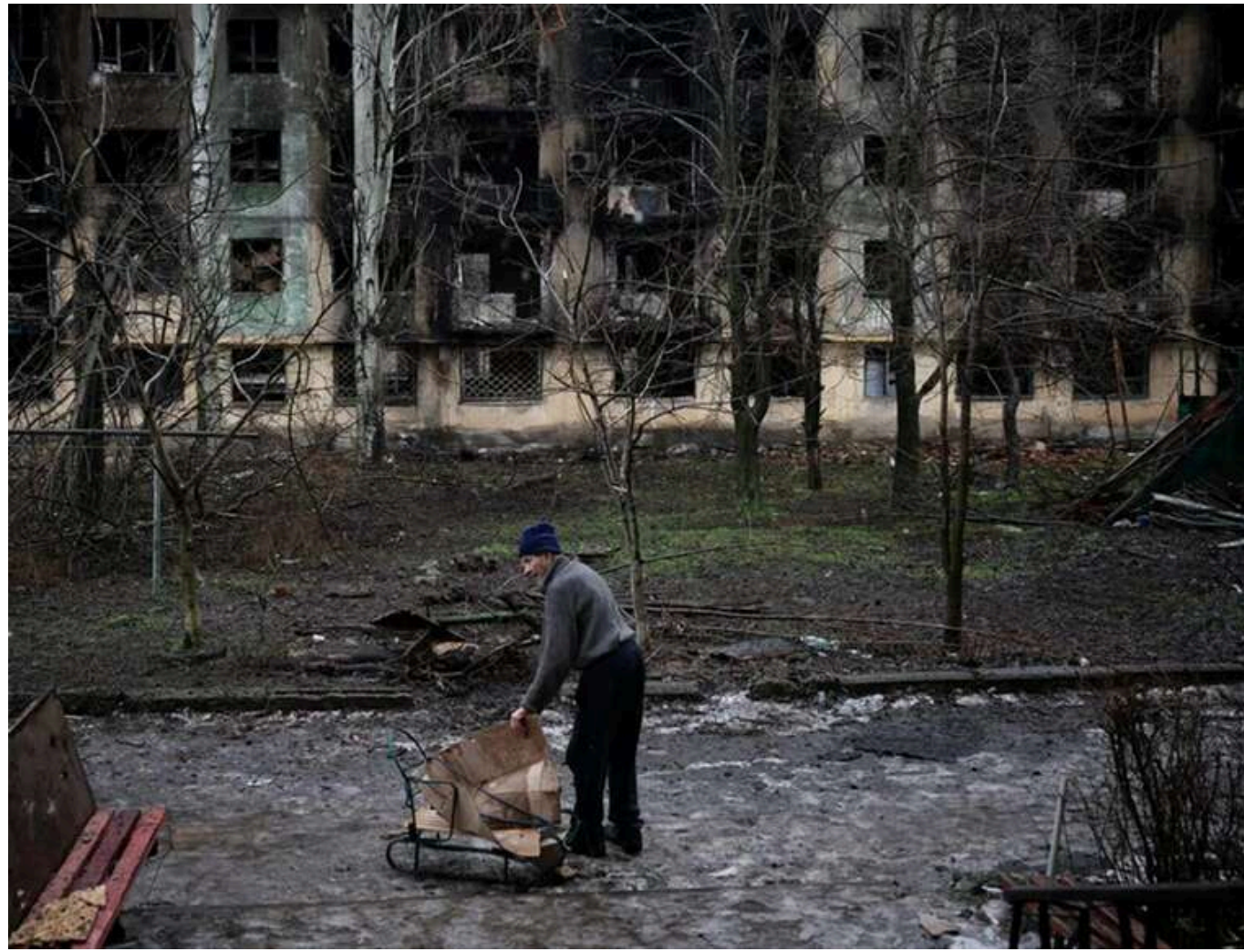
Окупанти можуть кинути всі сили на захоплення Костянтинівки, щоб заявити про успіх наступу, – експерт