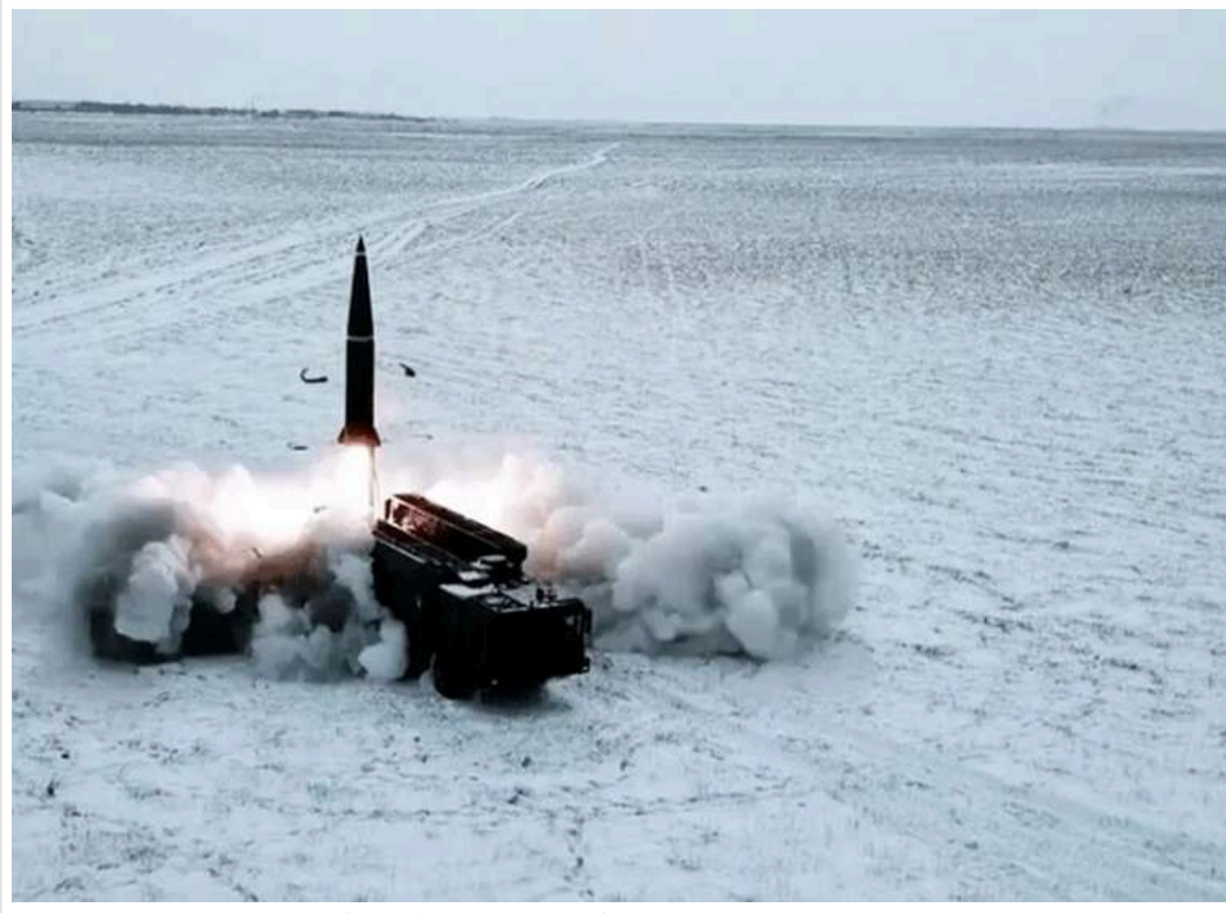
Ракети «Циркон» стали новою проблемою для українського неба: оцінка експерта