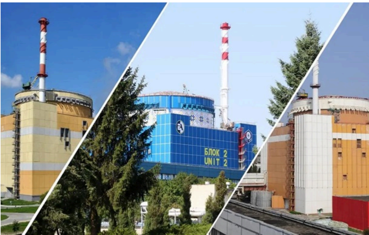
На підконтрольній Україні території три АЕС і дев'ять енергоблоків

Планово-попереджувальні ремонти на атомних станціях виконуються у середньому на чотири доби швидше, ніж передбачено.