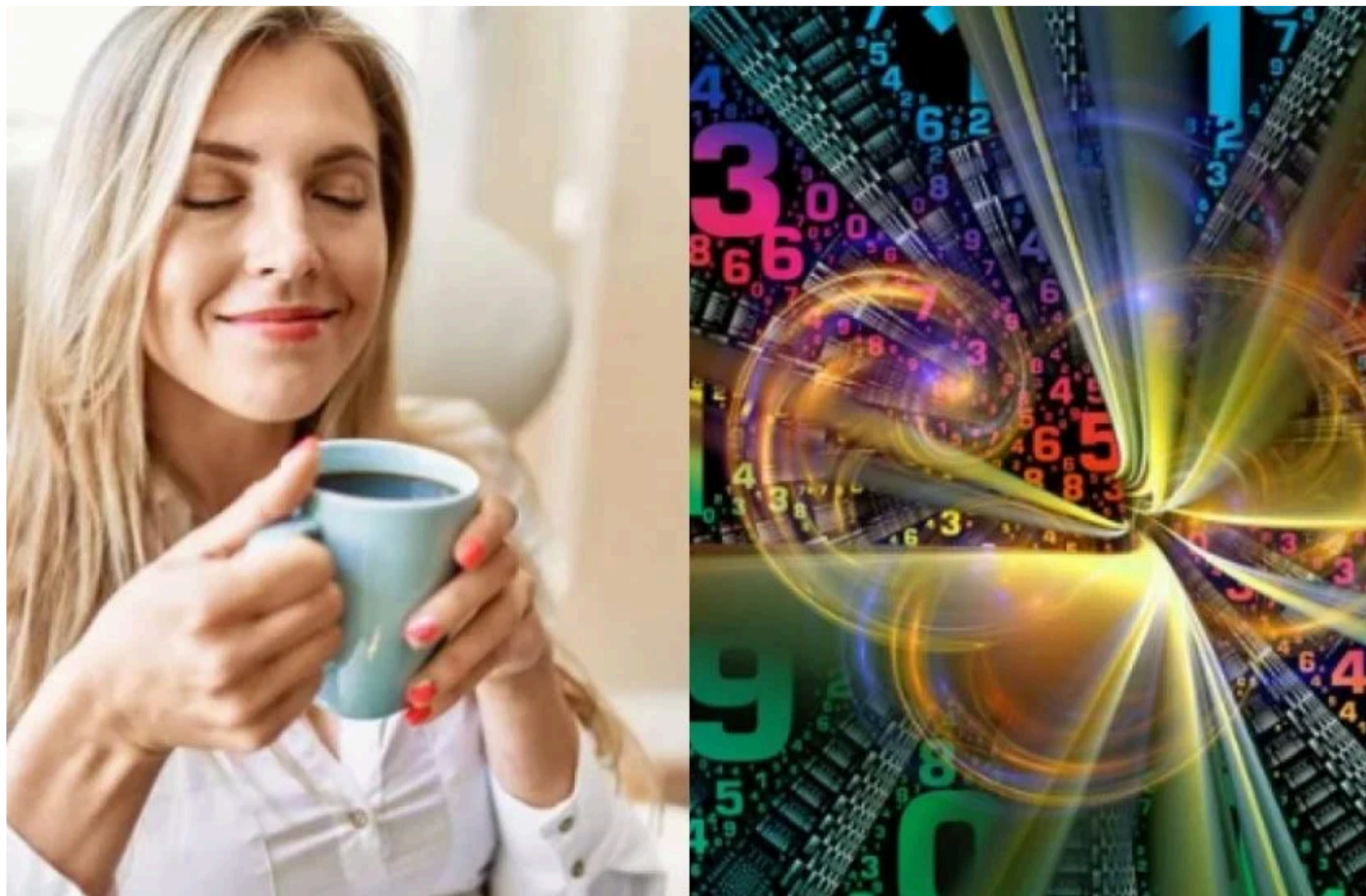
Характер людини / Фото з відкритих джерел

ОЛЬГА СТЕПАНОВА — 03 Червня 2026, 17:27 2 Mins Read — ПСИХОЛОГІЯ І СТОСУНКИ