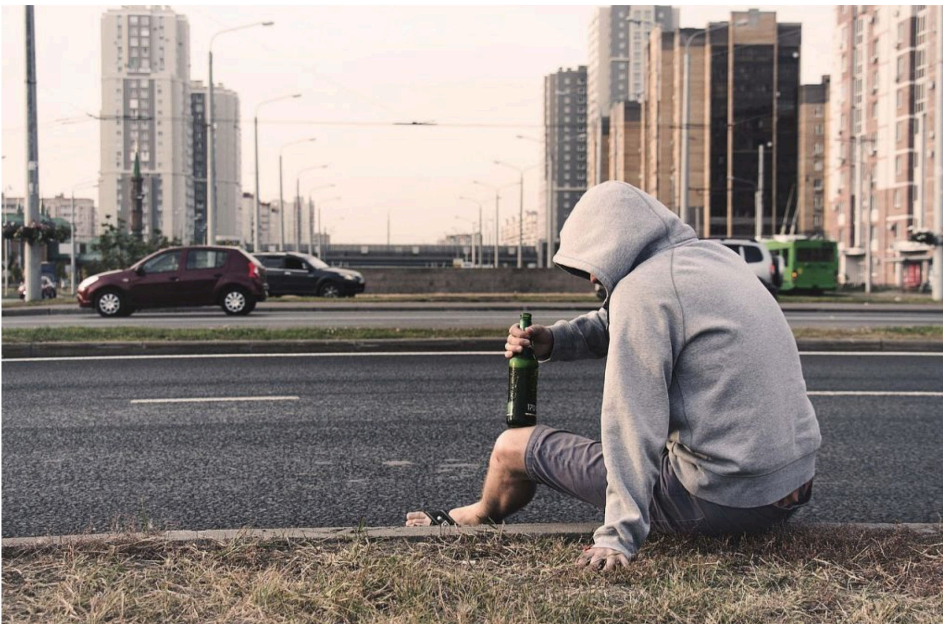
Похмілля / © pixabay.com

ОЛЬГА СТЕПАНОВА — 03 Червня 2026, 17:55 2 Mins Read — ЗДОРОВ'Я