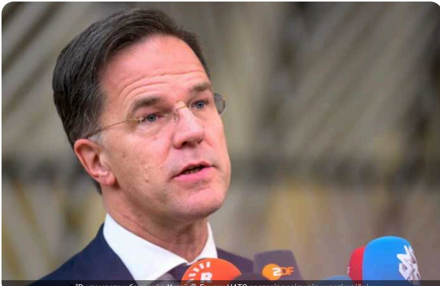
"Ви помрете у багнюці в Україні": Генсек НАТО застеріг росіян від участі у війні

Генеральний секретар НАТО Марк Рютте під час візиту до України розповів про зростання втрат Росії на війні та публічно звернувся до російської молоді.