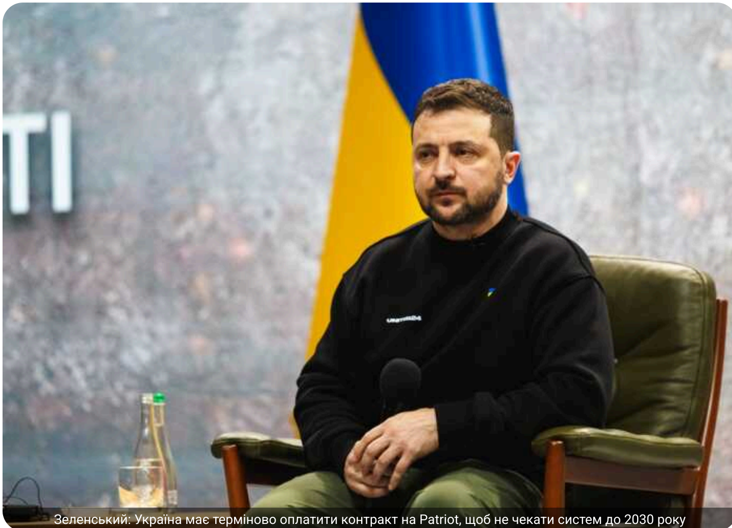
Зеленський: Україна має терміново оплатити контракт на Patriot, щоб не чекати систем до 2030 року

Президент Володимир Зеленський заявив, що Україні вкрай важливо терміново оплатити контракт зі США на поставки систем Patriot та ракет до них, інакше їх отримання може відтермінуватися до 2030 року.