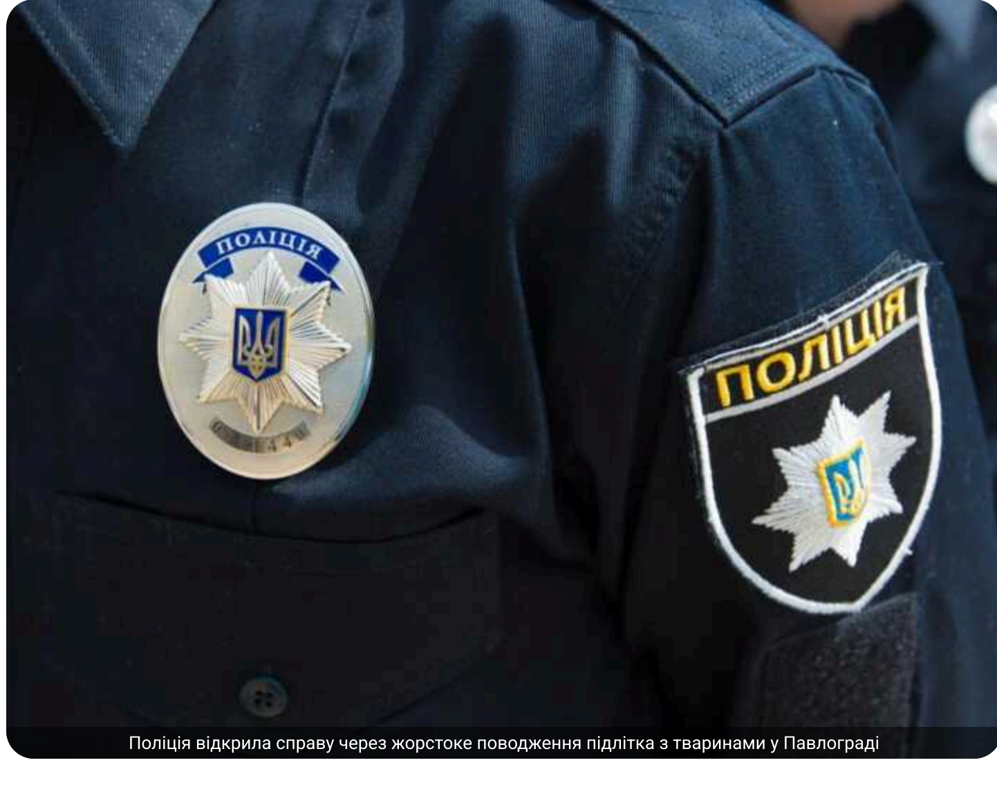
Поліція відкрила справу через жорстоке поводження підлітка з тваринами у Павлограді

У Павлограді на Дніпропетровщині широкий суспільний резонанс викликали відео та повідомлення про жорстоке поводження неповнолітньої дівчини з тваринами. Правоохоронці відкрили кримінальне провадження, а волонтери та зоозахисники заявляють про необхідність термінового порятунку інших тварин, які можуть перебувати в небезпечі. До справи вже допущилися всеукраїнські організації із захисту тварин.