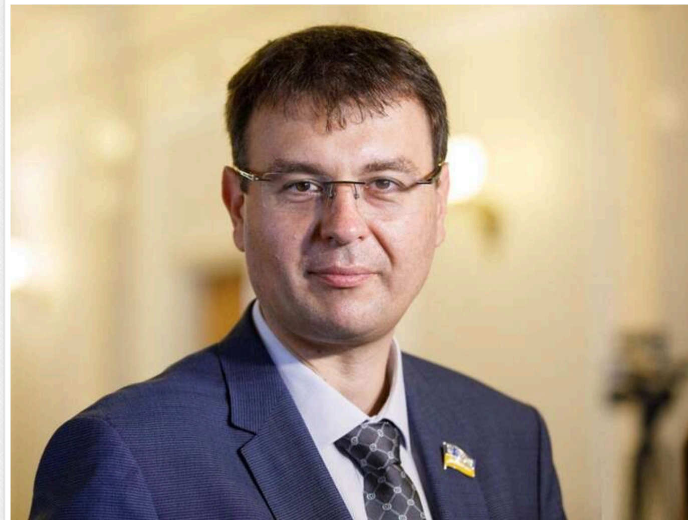
У Мінцифри офіційно звинуватили нардепа Гетманцева в системній дискредитації та дифіamacії

Міністерство цифрової трансформації України опублікувало повідомлення-відповідь на критику зі сторони народного депутата, очільника комітету з питань фінансової, податкової та митної політики Данила Гетманцева.