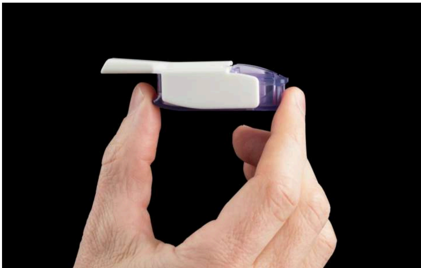
Фото: Інгаляційний інсулін для дітей з діабетом/metabolic.health

Управління з санітарного нагляду за якістю харчових продуктів та медикаментів США (FDA) дозволило застосовувати інгаляційний інсулін Afrezza у дітей та підлітків віком від шести років з цукровим діабетом першого та другого типу. Це перший інгаляційний інсулін, схвалений для використання у неповнолітніх пацієнтів, повідомила компанія-розробник MannKind.