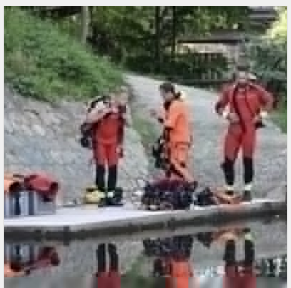
У Франції підлітки задушили 11-річного хлопчика через ..