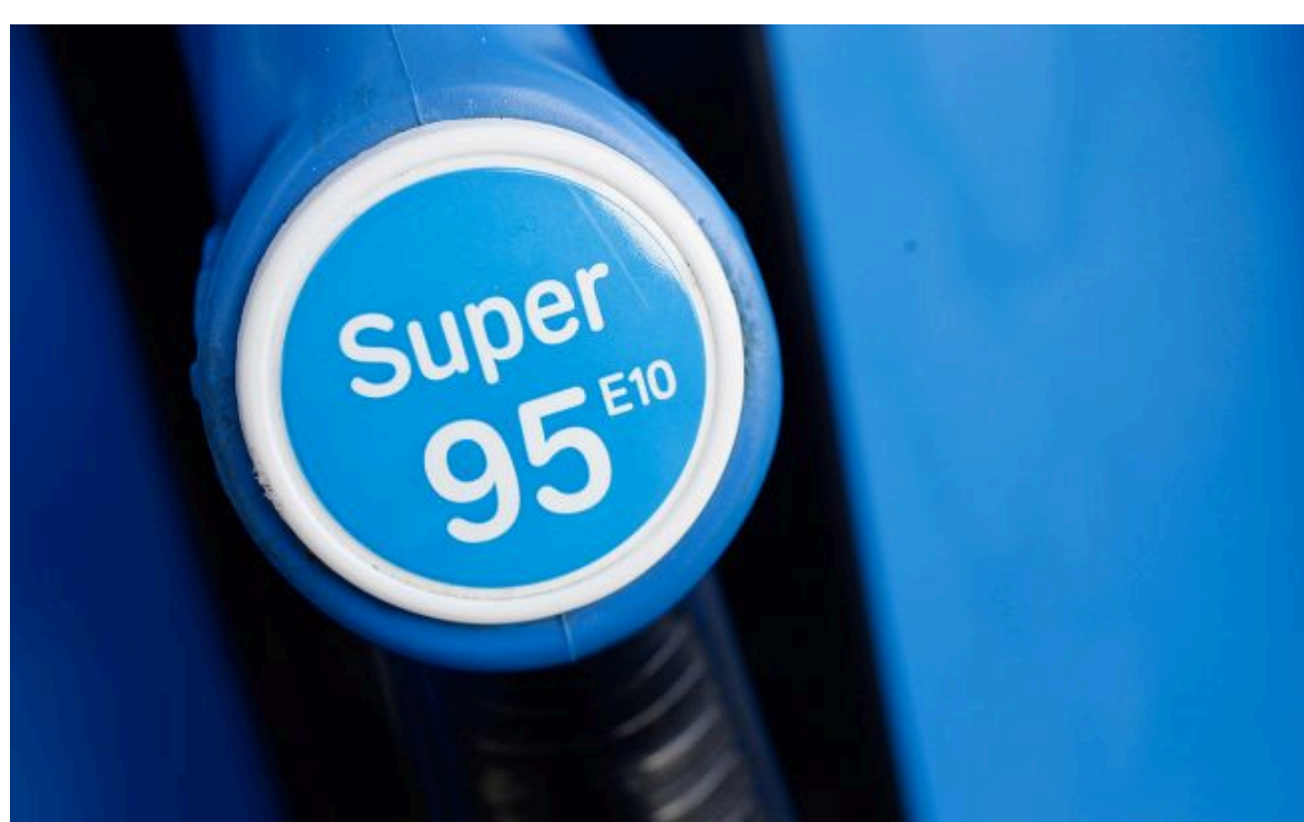
Фото: на АЗС України з 1 липня почне діяти новий стандарт пального Е10