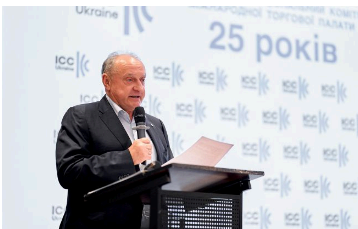
Президент ICC Ukraine Володимир Щелкунов