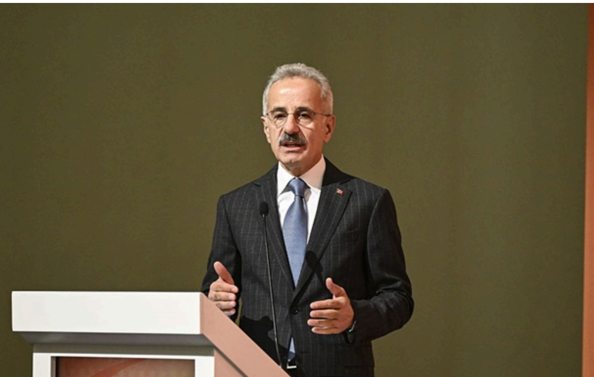
Міністр транспорту та інфраструктури Туреччини Абдулкадір Уралоглу

Масштабний логістичний маршрут створений для забезпечення надійної торгівлі між країнами Азії та Європи в обхід території Російської Федерації.