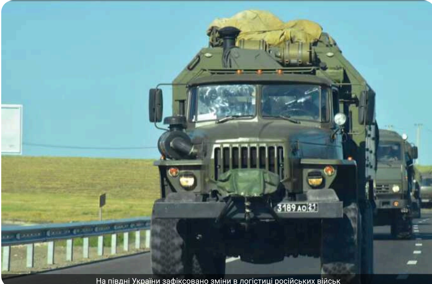
На півдні України зафіксовано зміни в логістиці російських військ

Російські загарбники на тимчасово окупованому півдні України змінили логістичний маршрут, перемістивши його ближче до узбережжя, щоб ускладнити ураження з боку Сил оборони України.