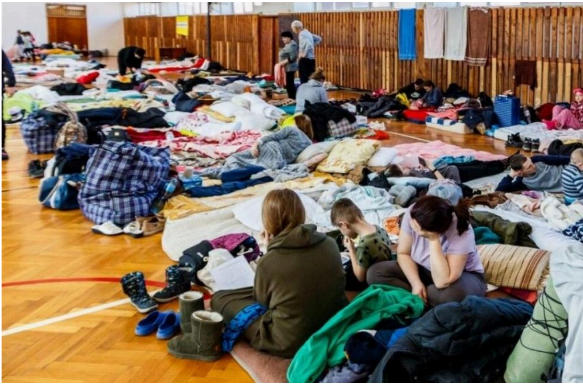
Українці за кордоном

ЛИСЕНКО КАТЕРИНА — 03 Червня 2026, 12:27 2 Mins Read — СУСПІЛЬСТВО