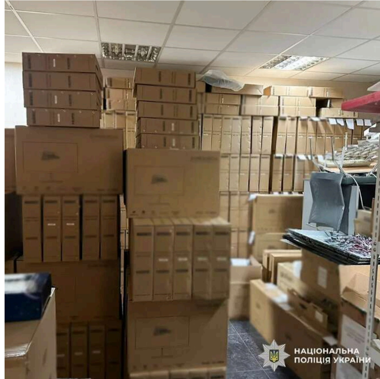
НАЦІОНАЛЬНА ПОЛІЦІЯ УКРАЇНИ

За даними слідства, організатором оборудки став місцевий підприємець, який контролював дві компанії, що постачали комп'ютерне обладнання. Через них він, за версією правоохоронців, двічі намагався поставити техніку, яка не відповідала вимогам тендерної документації, з метою подальшого заволодіння коштами.