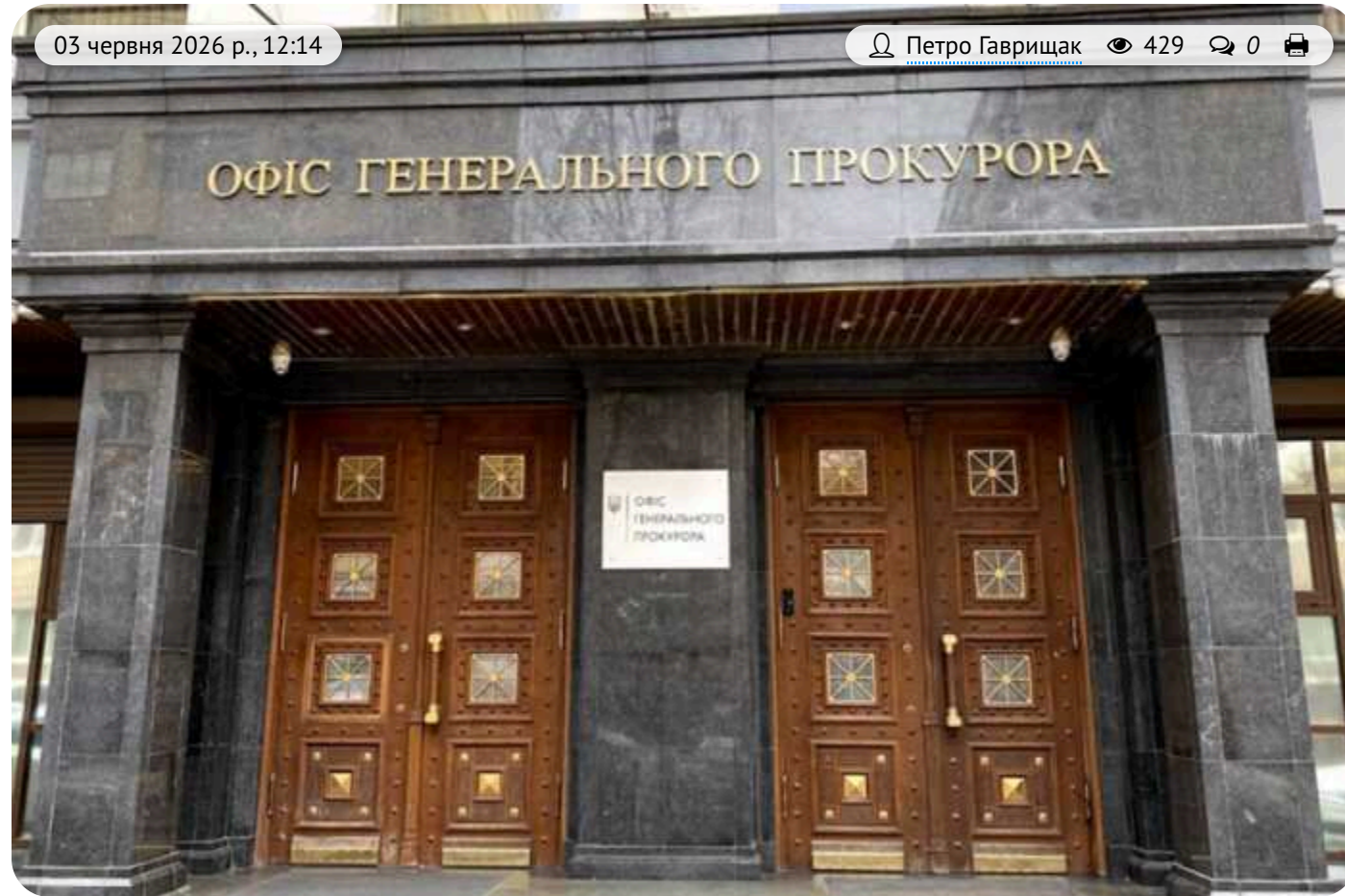
Від наукового обладнання до фіктивного таксі: як вкрадені в НАН України 5 мільйонів «легалізували» через вигадану оренду авто

Офіс Генерального прокурора скерував до суду справу про легалізацію коштів, ймовірно отриманих через закупівлю обладнання для установи Національної академії наук України за завищеними цінами.