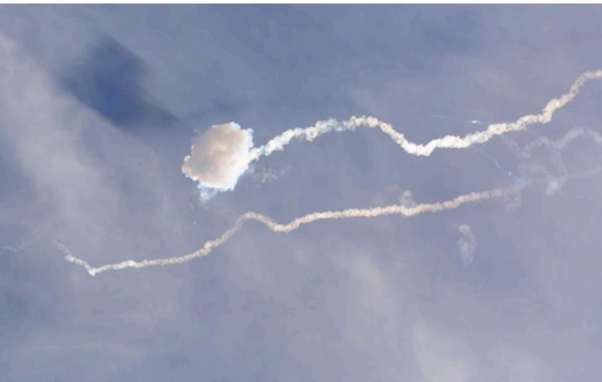
У Харкові збивають реактивні "шахеда"

Четверо постраждалих – чоловіки 18, 66, 68 років і жінка 58 років – зазнали вибухових травм і поранень склом. Їхній стан – середньої тяжкості.