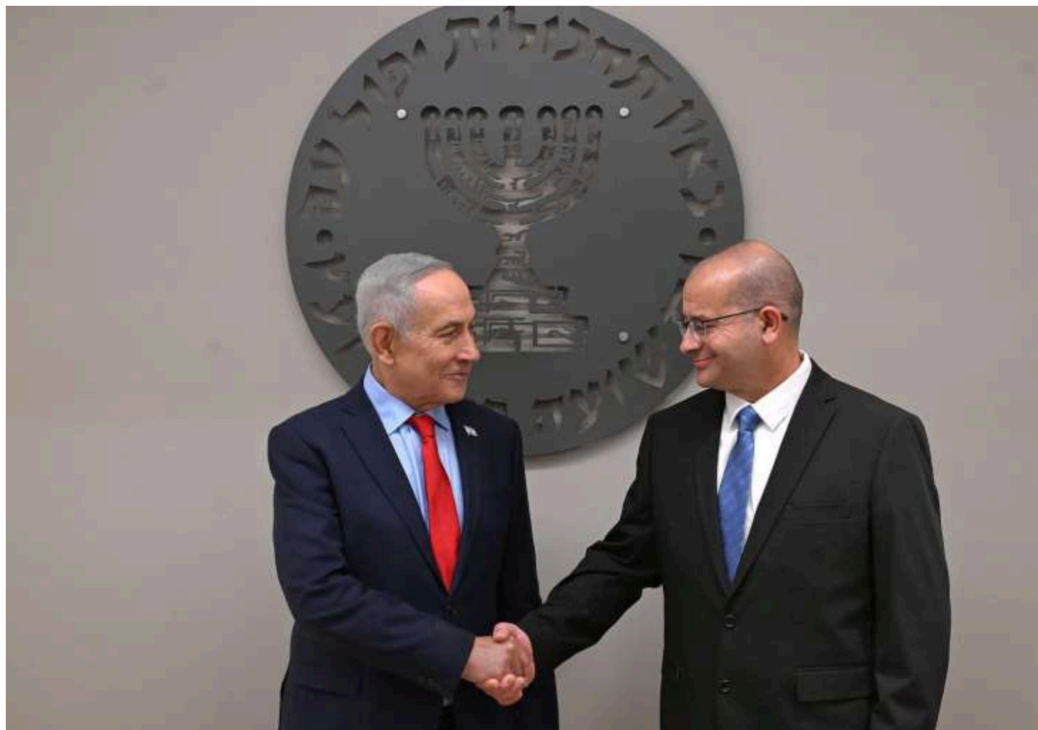
Фото: Біньямін Нетаньягу та Роман Гофман/ x.com/netanyahu

Новим директором ізраїльської розвідслужби "Моссад" став генерал-майор Роман Гофман, повідомив прем'єр-міністр Ізраїлю Біньямін Нетаньягу.