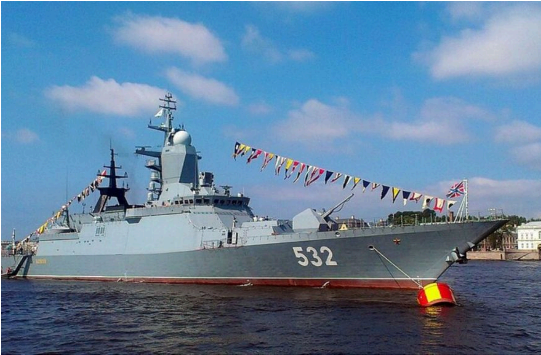
Fire Point

КАРПЕЦЬ ОЛЕКСАНДР — 03 Червня 2026, 11:25 ⌚ 1 Min Read — АРМІЯ І ЗБРОЯ