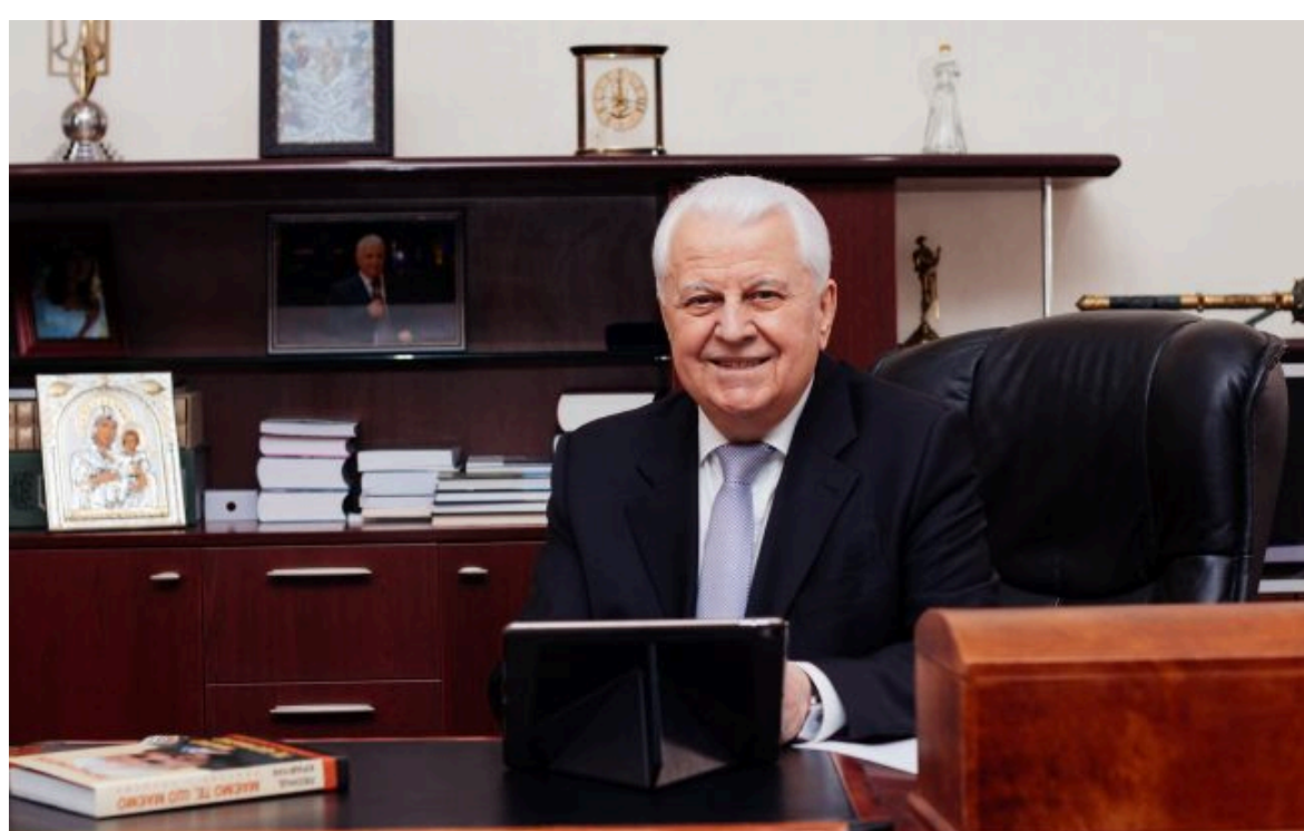
Фото: перший президент України Леонід Кравчук

Не витрачай час на шум! Читай тільки суть з РБК-Україна у Google