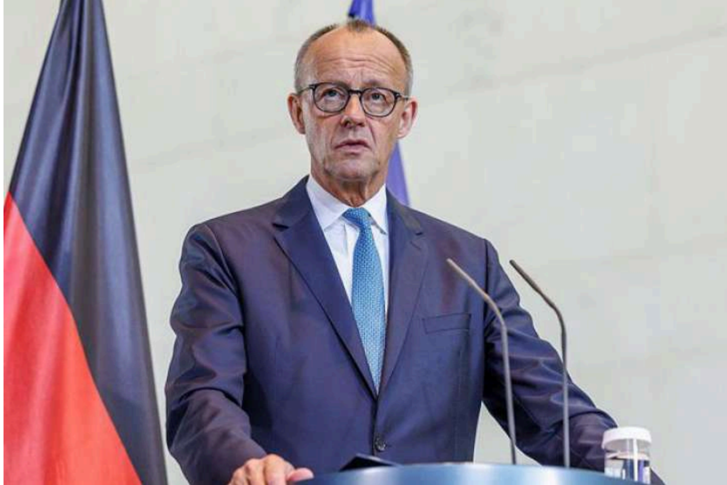
Фрідріх Мерц

Канцлер Німеччини Фрідріх Мерц підтримав відкриття першого переговорного кластера щодо вступу України до ЄС і фактично закликав не прив'язувати цей процес до претензій Угорщини. За його словами, двосторонні питання між Києвом і Будапештом мають вирішуватися окремо.