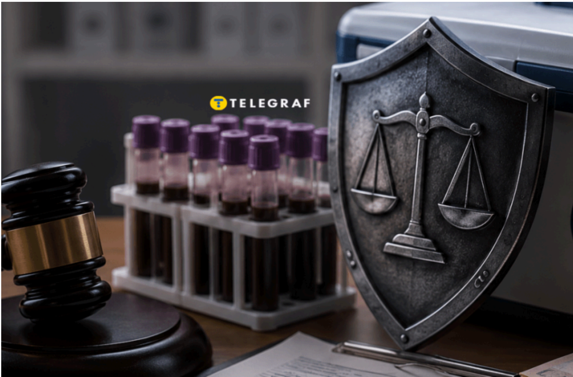
Донорська кров

ОЛЬГА СТЕПАНОВА — 03 Червня 2026, 06:53 2 Mins Read — ЗДОРОВ'Я