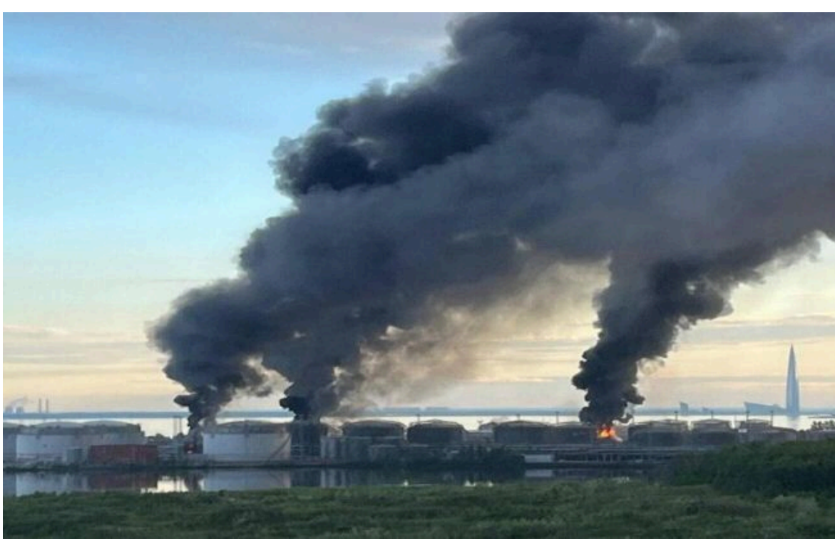
Фото: пожежа в порту Петербурга - горить термінал (t.me/supremova_plus)

Не витрачай час на шум! Читай тільки суть з РБК-Україна у Google