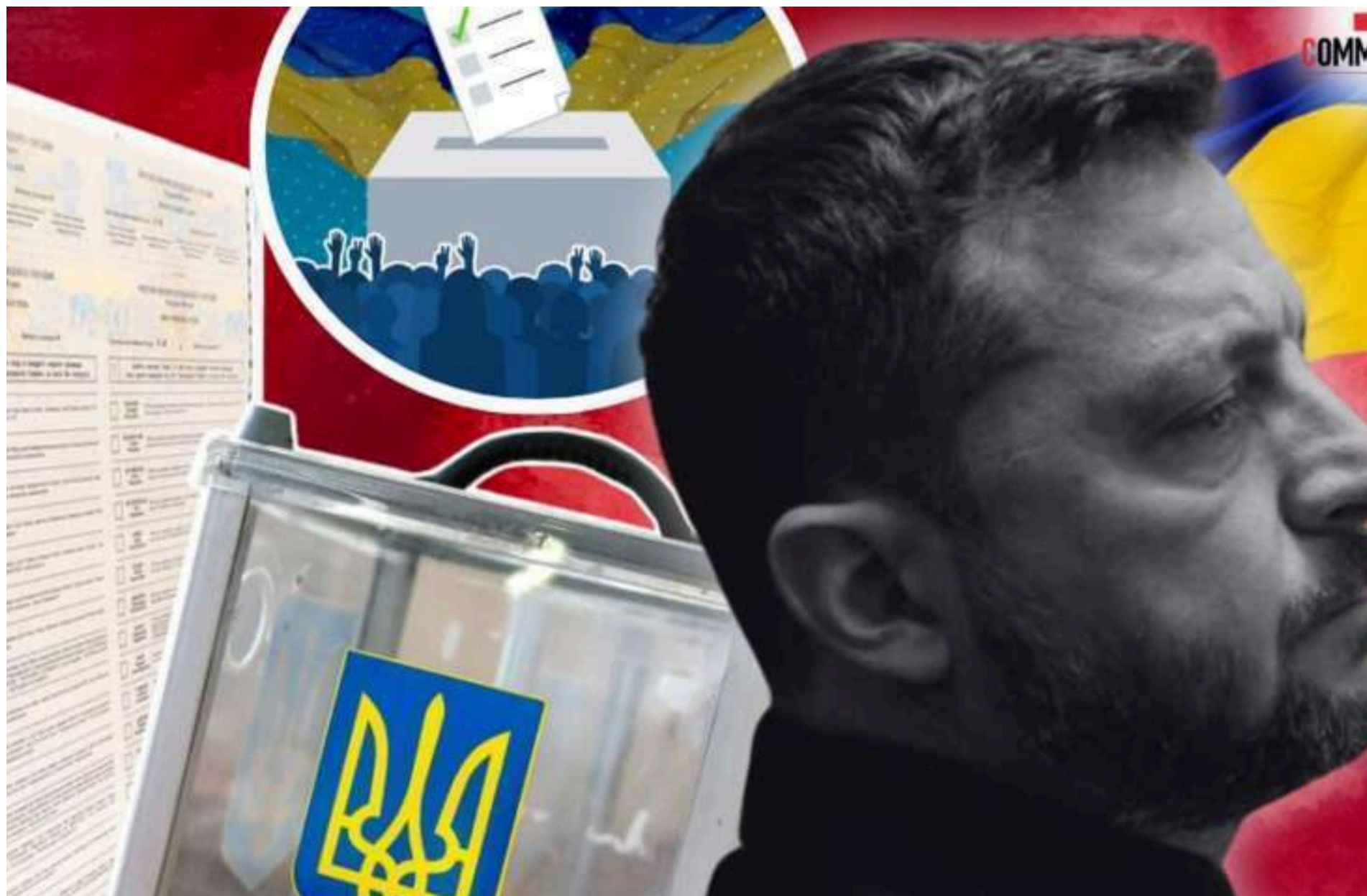
Вибори президента

КАРПЕЦЬ ОЛЕКСАНДР — 03 Червня 2026, 06:23 2 Mins Read — ПОЛІТИКА