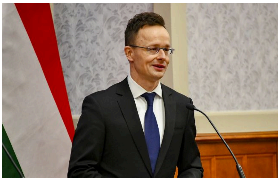
Фото: экс-глава МЗС Угорщини Петер Сіярто (flickr by U.S. Department of State)