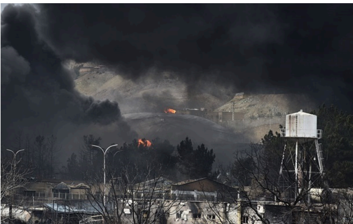
США завдали ударів з метою самооборони по острову Кешм у відповідь на спробі нападу з боку Ірану на Близькому Сході

Військові удари між США та Іраном відбуваються під час мирних переговорів щодо припинення тримісячної війни.