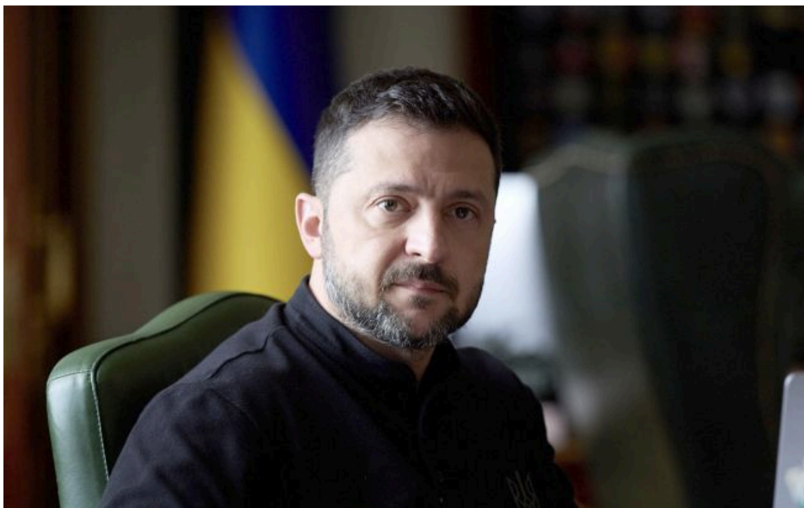
Фото: Володимир Зеленський (facebook.com/zelenskyyofficial)