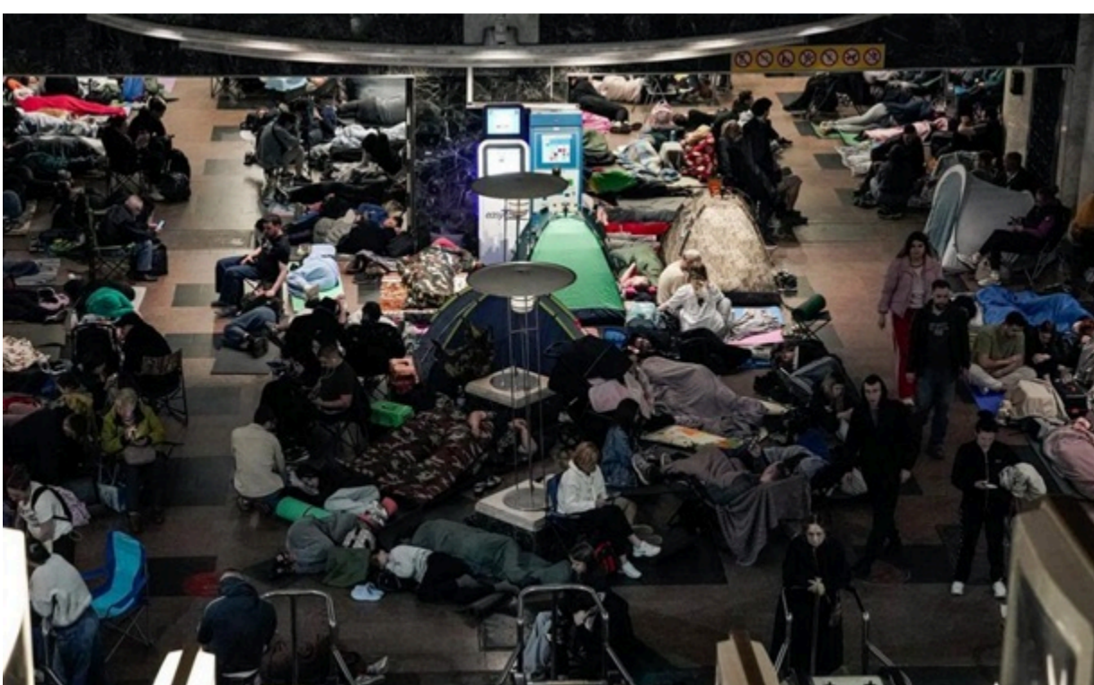
Одна зі станцій метро в Києві під час повітряної тривоги

93% від загальної кількості перевірених споруд отримали зауваження за підсумками інспекцій.