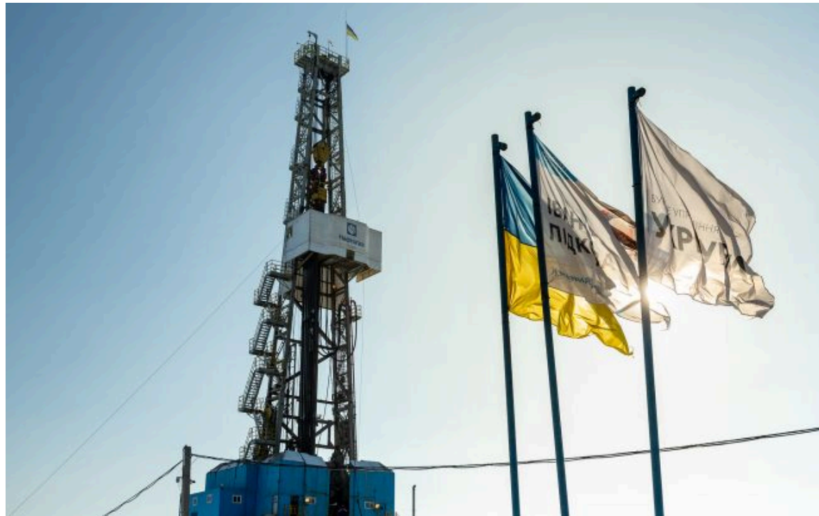
Фото: бурова установка "Нафтогазу" на газовому родовищі в Україні (naftogaz.com)