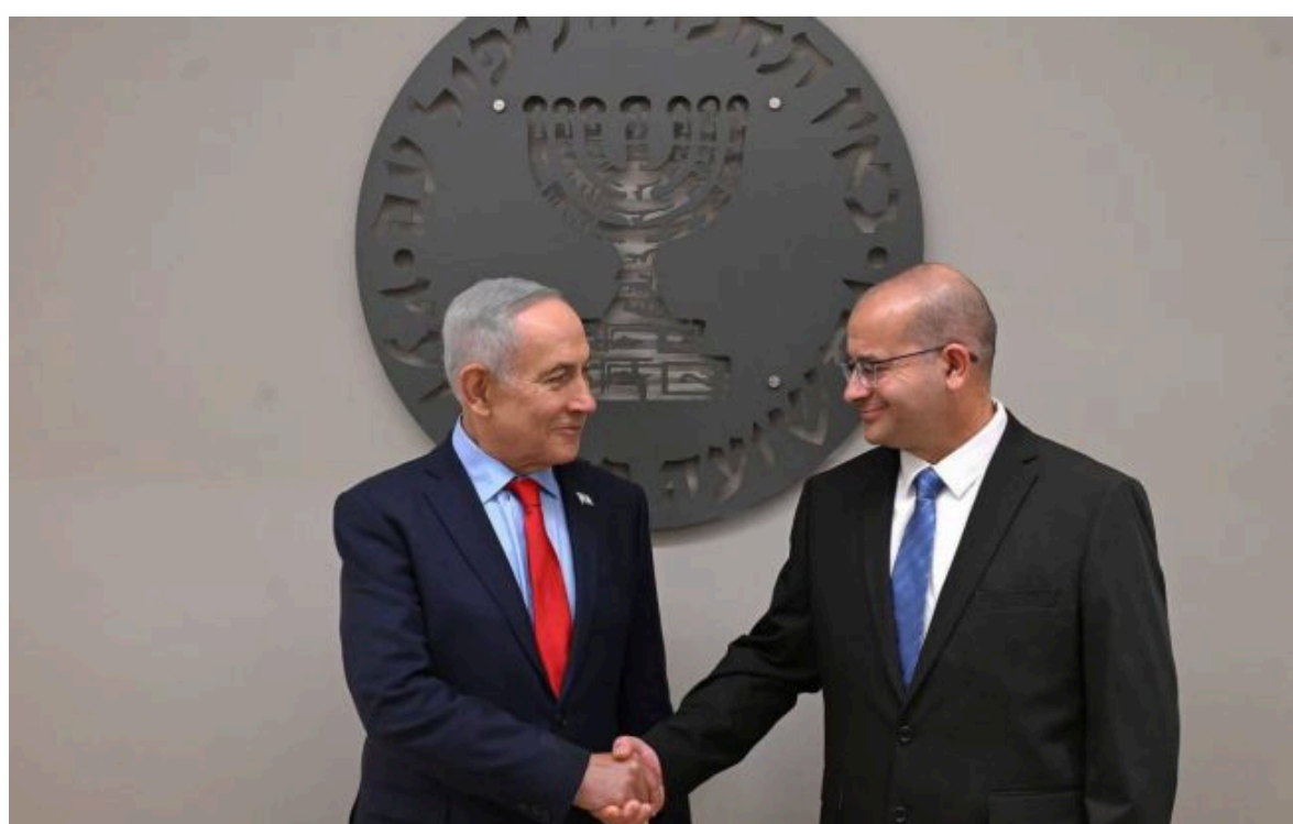
Фото: Бін'ямін Нетаньяху і Роман Гофман (Telegram-канал Нетаньяху)