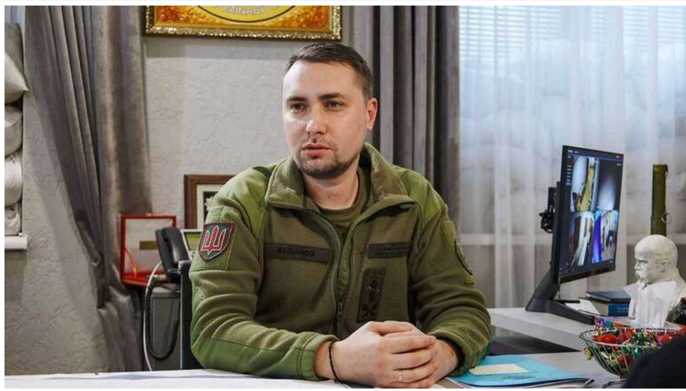
Буданов заявив, що Польща може стати наступною ціллю Росії

Керівник Головного управління розвідки Кирило Буданов висловив думку, що Кремль прагне відновити імперську модель держави, подібну до СРСР, з контролем над країнами колишнього Варшавського договору. За його словами, якщо Україна зазнає поразки у війні, агресія Росії на цьому не зупиниться.