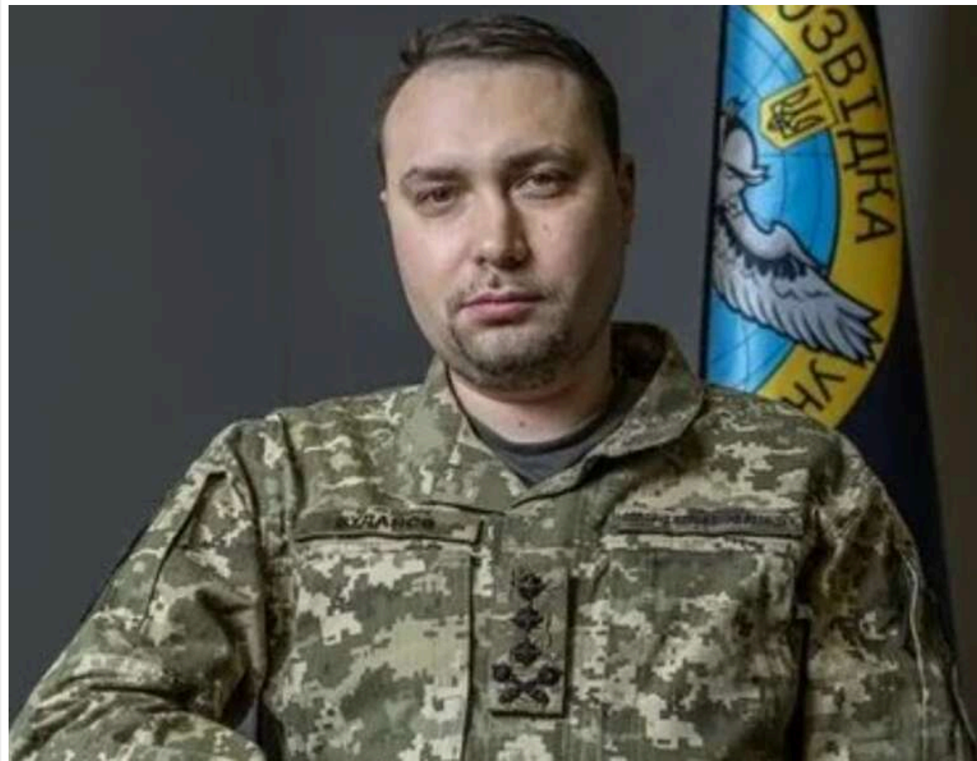
Буданов: Битви в Гостомелі, Мощуні та Ірпені перешкодили Росії реалізувати план "Київ за три дні"

Бої у Гостомелі, Мощуні та Ірпені на початку повномасштабного вторгнення завадили Росії виконати план спеціальної військової операції «Київ за три дні».