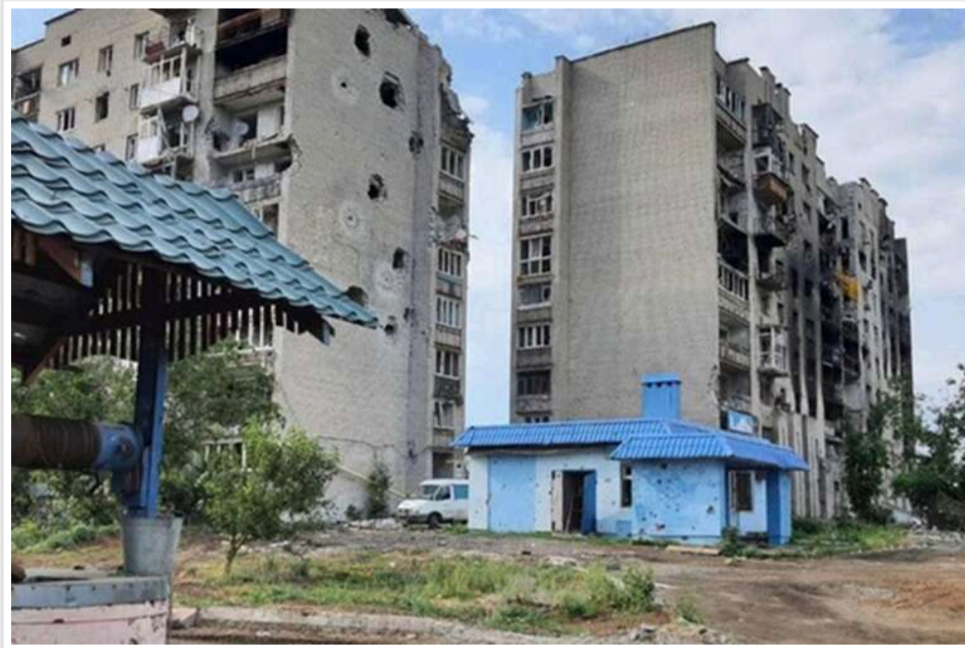
Окупанти в Луганській області почали «узаконювати» крадіжку житла

В окупованій Луганській області була проведена інвентаризація і створено "список квартир і будинків, які наразі мають ознаки беззайності".