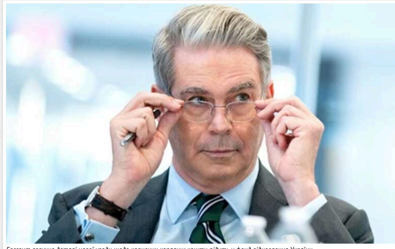
Бессент озвучив деталі нової угоди щодо корисних копалин: кошти підуть у фонд відновлення України

Міністр фінансів США Скотт Бессент виступив на захист прагнення Дональда Трампа укласти угоду з Україною щодо розробки її природних ресурсів і важливих корисних копалин. Цей план, за словами Бессента, має стати основою для економічного зростання України в післявоєнний період і не передбачає жодного економічного примусу.