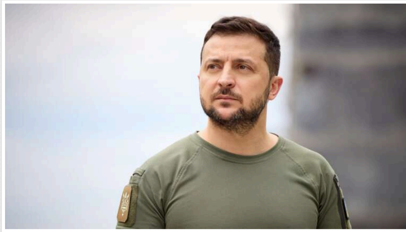
Зеленський хоче особисто зустрітис з Трампом для обговорення угоди про корисні копалини

Президент України Володимир Зеленський планує особисто зустрітис з президентом США Дональдом Трампом наступного тижня у Вашингтоні для обговорення угоди щодо корисних копалин.